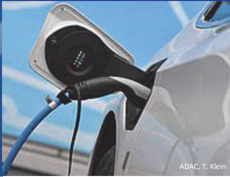
ADAC, T. Klein